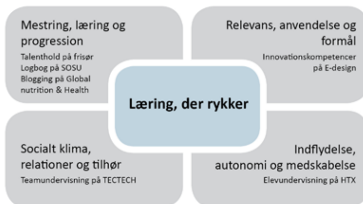
Figur 2: Denne model viser de fire faktorer, som fremmer motivation og læring