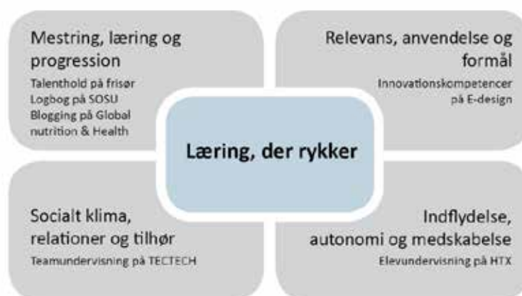
Figur 3. Den ovenstående model viser eksperimenternes indsatsområder.

Tre eksperimenter retter sig således primært mod at understøtte elevernes personlige læreproces og oplevelse. Det drejer sig om to eksperimenter, der via henholdsvis en logbog og en blog søger at understøtte elevernes refleksioner over egen læreproces, samt et eksperiment omkring talenthold for særlige talentfulde elever, hvor målet er at udvikle et talentspottingværktøj og køre de særligt talentfulde elever i stilling til frisørkonkurrencer.